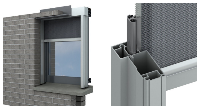
Proscreen Zip 95 met recess zijgeleiding