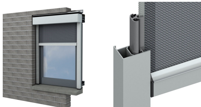
Proscreen Zip met standaard zijgeleiding

Standaard leverbaar met rechte voorlijst. Kap 75 en 85 ook leverbaar met een afgeschuinde voorlijst. Bij de Proscreen Zip 95 kan tevens worden gekozen voor een recess zijgeleiding, welke dient als afdichting van de spouw.